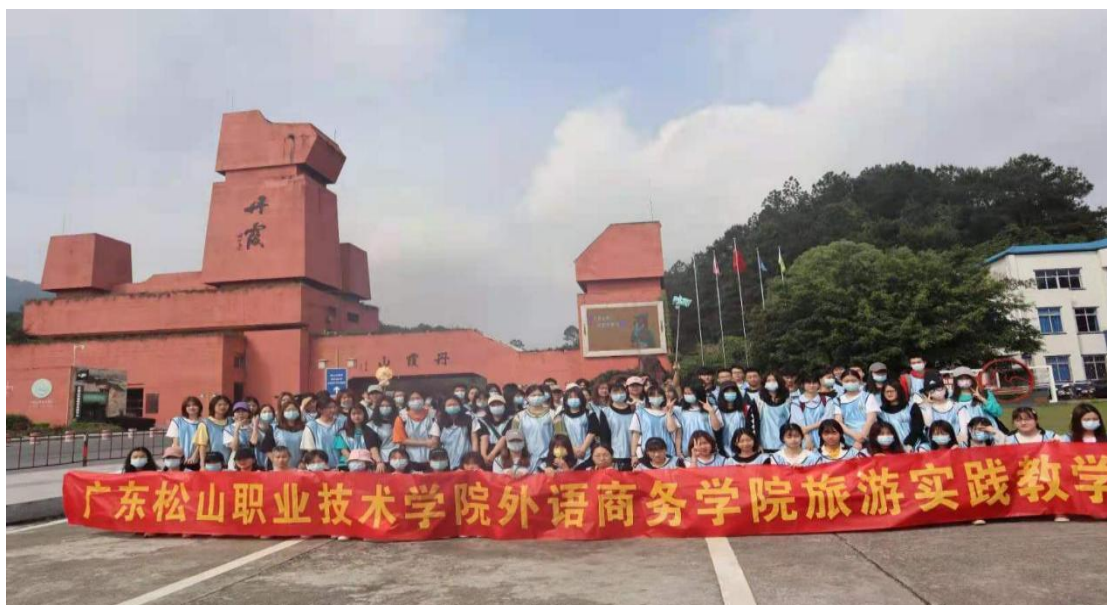
旅游实践教学周之丹霞山综合实践教学师生合影