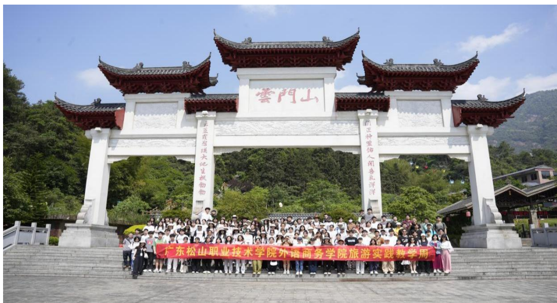
旅游实践教学周之云门山实践教学师生合影