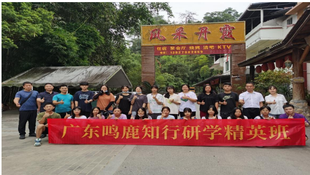
韶关鸣鹿研学精英班

为更好促进产教深度融合和校企合作可持续发展，培养研学精英，2021年9月我校与广东鸣鹿知行研学公司合作成立研学导师订单班，实现校企联合培养、定向就业。