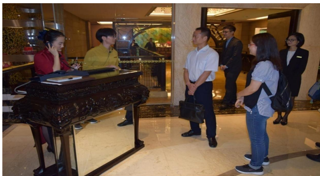
外语商务学院师生到广州星河湾酒店与毕业生交流