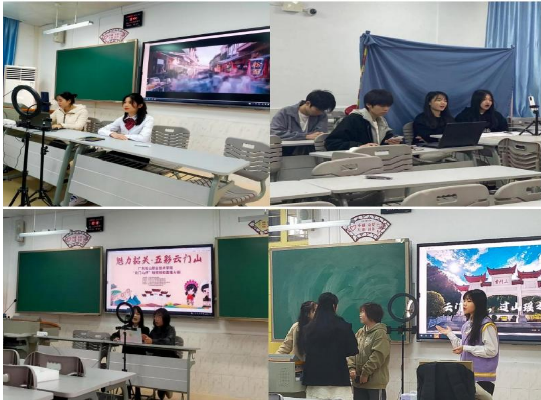
“云门山杯”短视频和直播大赛选手直播现场图

2、本专业连续多年举办“松山之星”导游服务技能大赛。此项大赛设有“景区导游词讲解”“导游英语口语”“导游才艺展示”“导游知识测试”四个环节。在景区导游词讲解环节，要求选手们生动地讲解全国各地著名旅游景点；导游英语口语环节为导游运用英语服务游客的能力，锻炼了选手对游客英语服务的实操能力；导游才艺展示环节，要求选手们现场展示书法、朗诵、舞蹈、歌唱及乐器演奏等导游才艺，发挥自身的才华和展示自身最佳的形象。