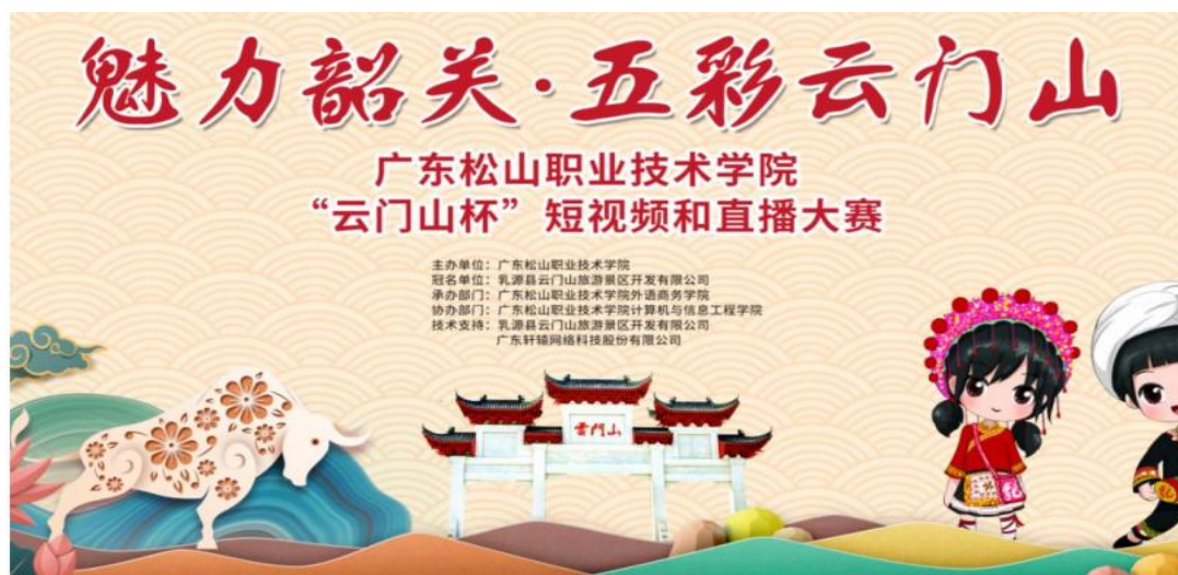
“云门山杯”短视频和直播大赛宣传海报

1、2022年，旅游英语专业学生参加我校与乳源县云门山旅游景区开发有限公司共同举办的“云门山杯”短视频和直播大赛，紧跟文旅新媒体发展趋势。