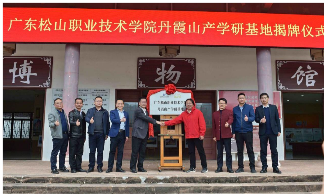
我校与丹霞山续签产学研基地合作协议

已与韶关市丹霞山管理委员会续签产学研基地合作协议，与韶关市商务局签订战略合作备忘录，定期开展产学研合作、企业走访、人才需求调研。