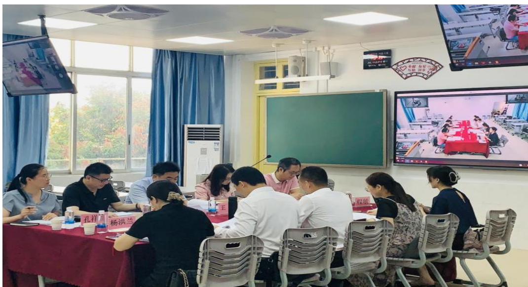
校企专家开展 2023 级外语商务学院专业人才培养方案论证