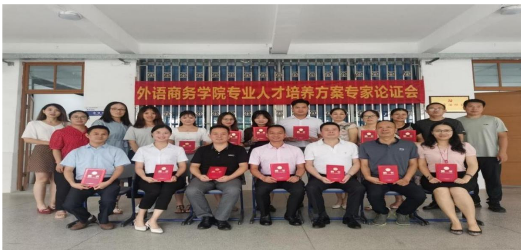
2020年9月我校旅游英语专业建设论证会委员会合影

2020年—2025年，每年均举办专业建设研讨会、人才培养方案论证会，并成立专业建设指导委员会，邀请行业专家优化课程体系。