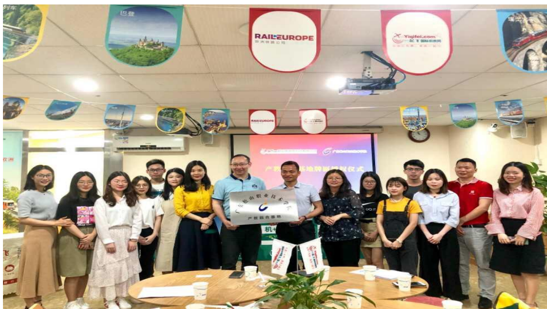
外语商务学院师生到广州一起飞国际旅行社与毕业生交流