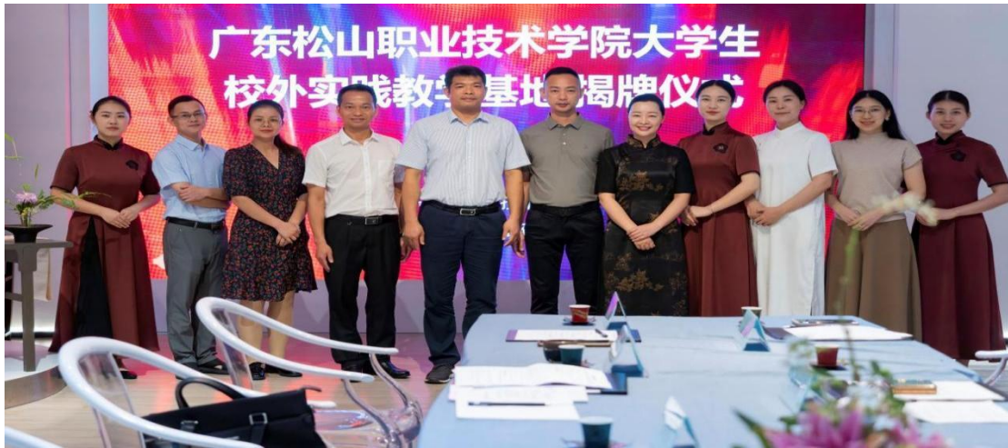
我校与广州翁暖文化传播有限公司校企人员合影