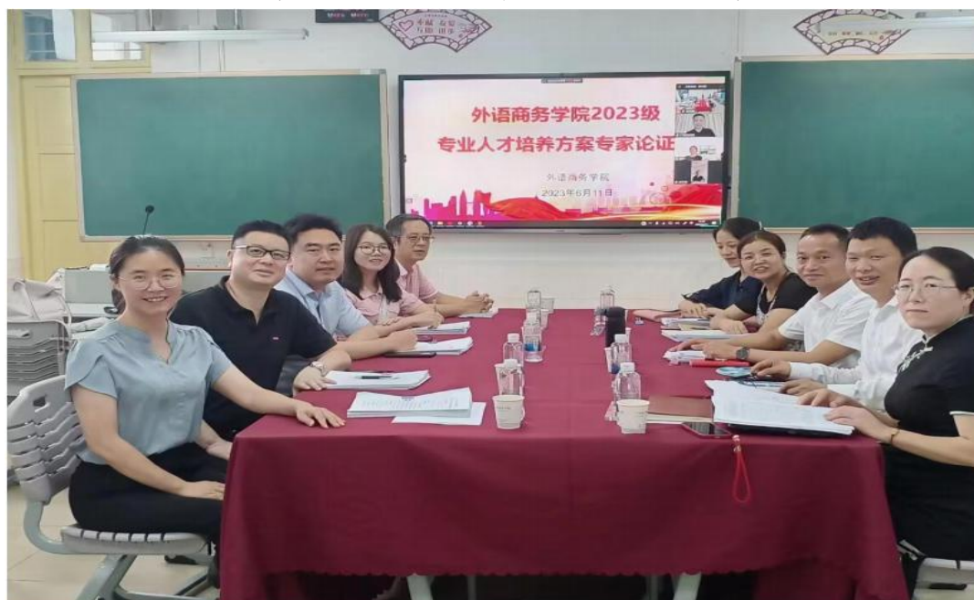
2023 级外语商务学院专业人才培养方案论证校企专家合影