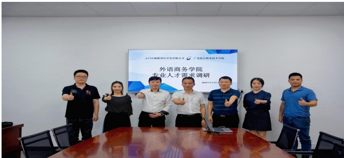
赴韶关云门山旅游景区开发有限公司开展人才需求调研