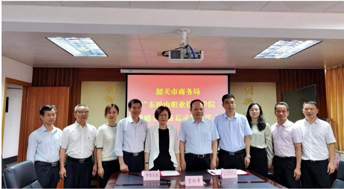
我校与韶关市商务局签订《战略合作协议》