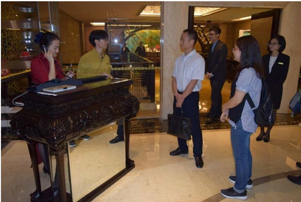
外语商务学院副院长与广州星河湾酒店实习的学生交谈

2. 本专业非常重视学生实践教学，积极拓展学生实习基地建设，定期组织学生开展顶岗实习工作。迄今为止，本专业在韶关风度华美达广场酒店、广州星河湾酒店等多家企业建立学生实习基地，为学生提供大量提升专业技能的实习机会。