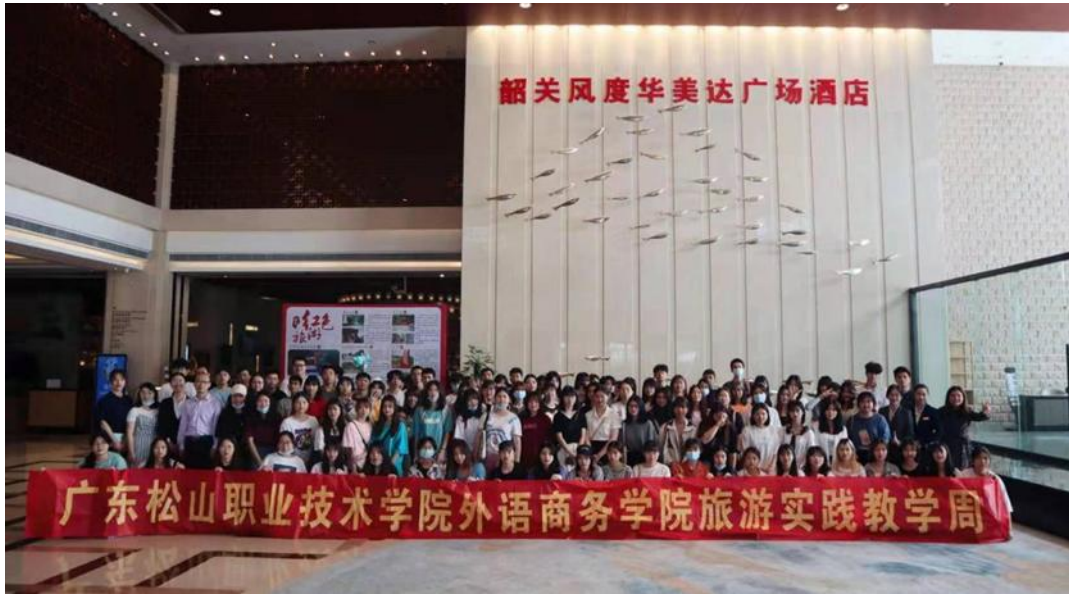
外语商务学院实践教学之韶关风度华美达广场酒店实践教学师生合影

2. 本专业非常重视学生实践教学，积极拓展学生实习基地建设，定期组织学生开展顶岗实习工作。迄今为止，本专业在韶关风度华美达广场酒店、广州星河湾酒店等多家企业建立学生实习基地，为学生提供大量提升专业技能的实习机会。