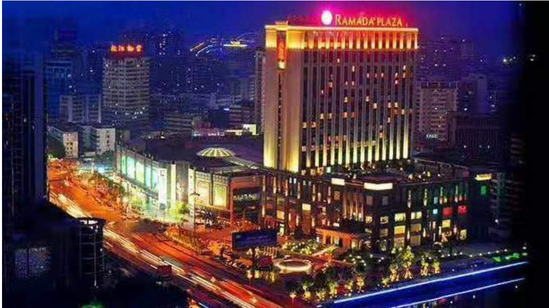
校企合作单位“韶关风度华美达广场酒店”大楼

目前我校酒店管理与数字化运营专业已与韶关风度华美达广场酒店（五星级）达成校企深度合作关系，联合开办“华美达人才班”，共同培养酒店行业的专业人才。