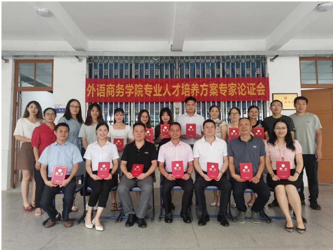
专家论证会全体人员合影

此外，本专业坚持以赛促学、以赛促教，积极鼓励并组织 学生参加各类职业技能竞赛和创新创业大赛。通过竞赛锻炼学生综合能力、激发学习热情，同时将竞赛内容与日常教学有机结合，以竞赛成果反哺教学内容和 方法改革，形成教学相长、良性循环的发展格局。通过上述多维度、系统化的专业优化建设举措，本专业的人才培养质量和办学水平持续稳步提升。