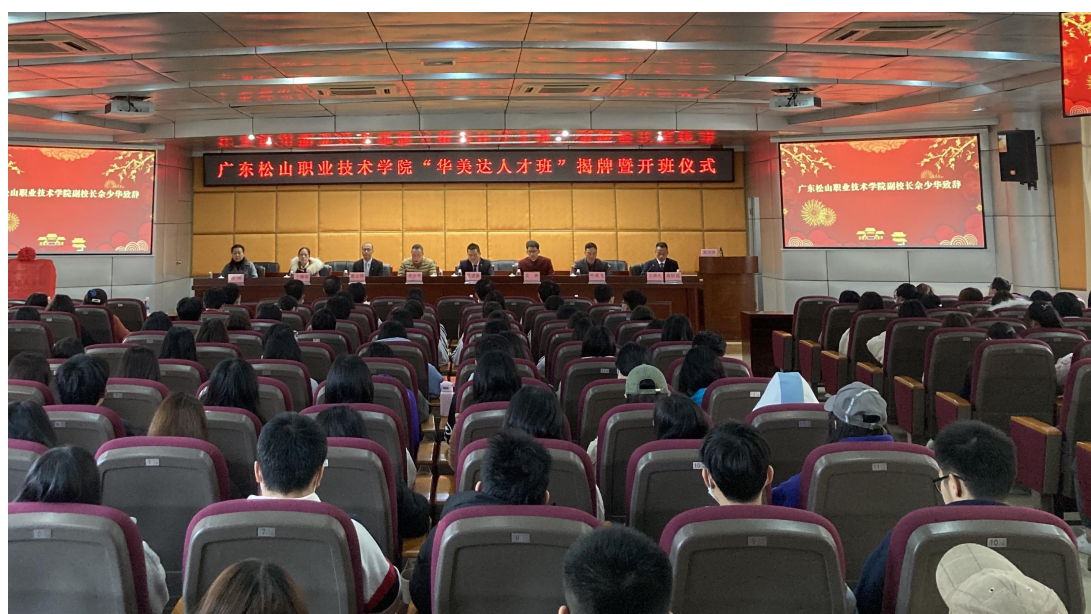
“华美达人才班”揭牌暨开班仪式

本专业的特色主要体现在专业课程设置和实践教学等方面。首先课程设置中将基础课、专业课、实践教学形成三位一体，课程内容注重创造思维和实践能力的培养，加强教学实践实习基地建设，满足实践教学与实习的要求。其次我校酒店管理与数字化运营专业已与韶关风度华美达广场酒店（五星级）达成校企深度合作关系，联合开办“华美达人才班”，共同培养酒店行业的专业人才。