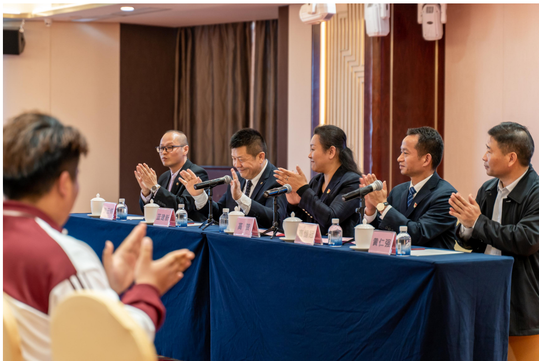
第二届“华美达人才班”开班仪式现场