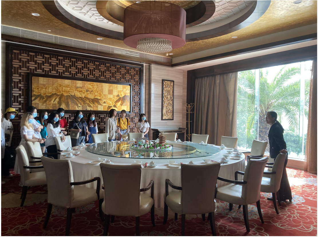
同学们去往韶关风度华美达广场酒店参观学习