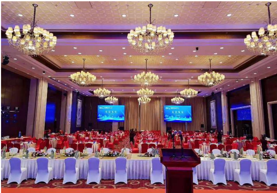
校企合作单位“韶关风度华美达广场酒店”大楼