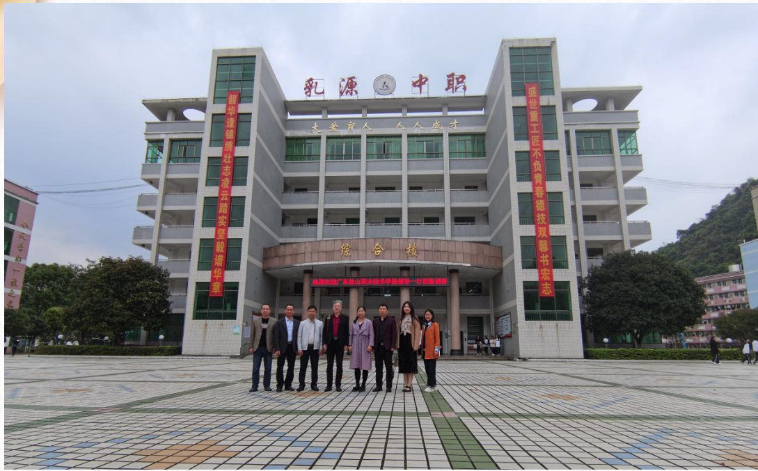
2024 年旅游管理专业参访乳源中职进行三二分段招生工作对接