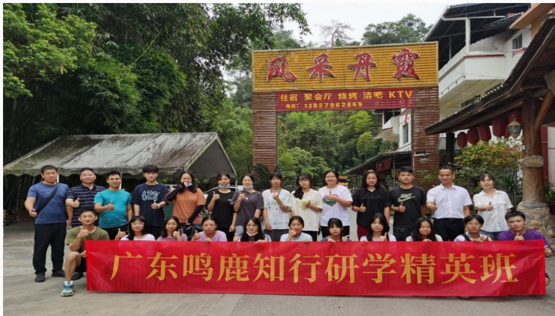
2021 年广东鸣鹿知行研学订单班全体师生

旅游管理专业与韶关市鸣鹿研学合作开展为期 3 个月的企业订单班项目，聚焦学生学习能力、创新能力与实践操作能力的提升，助力学生实现专业技能与行业需求的精准对接。