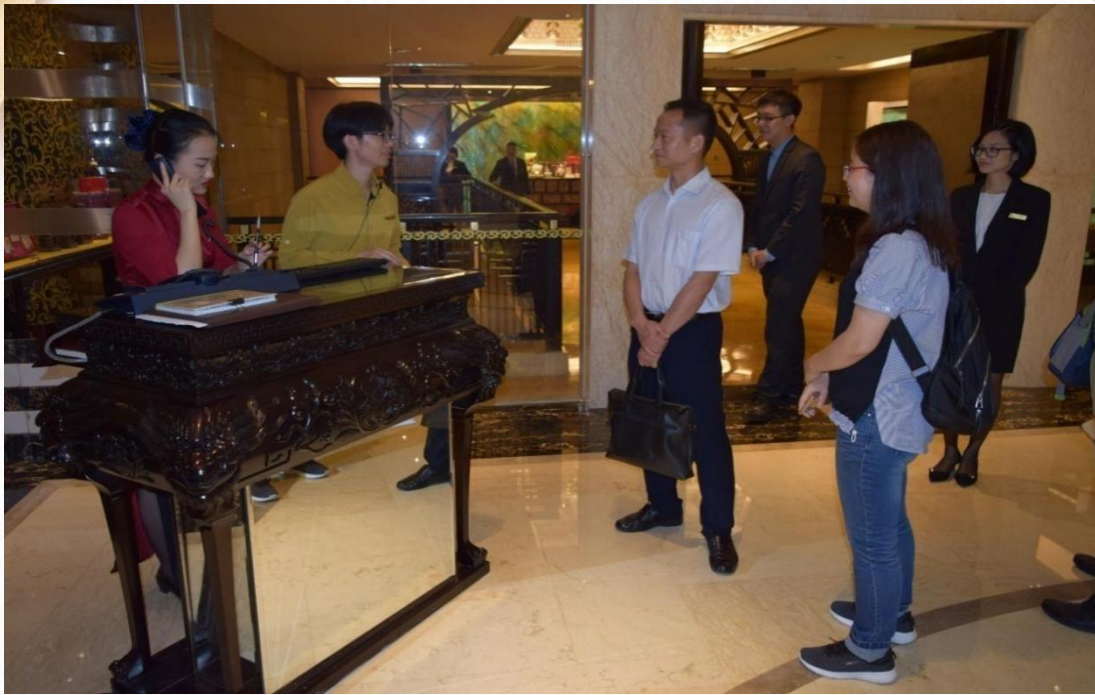
文化旅游学院师生到广州星河湾酒店与毕业生交流