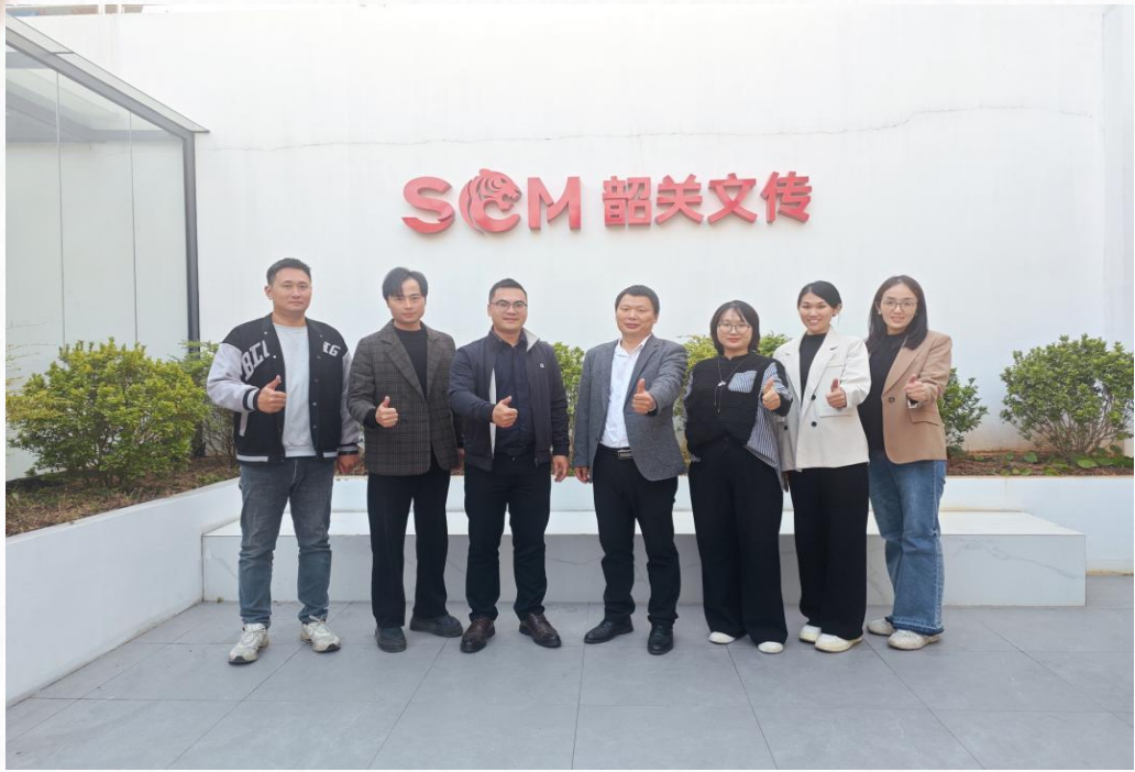
学院领导老师前往韶关市文化传媒集团开展校企合作交流