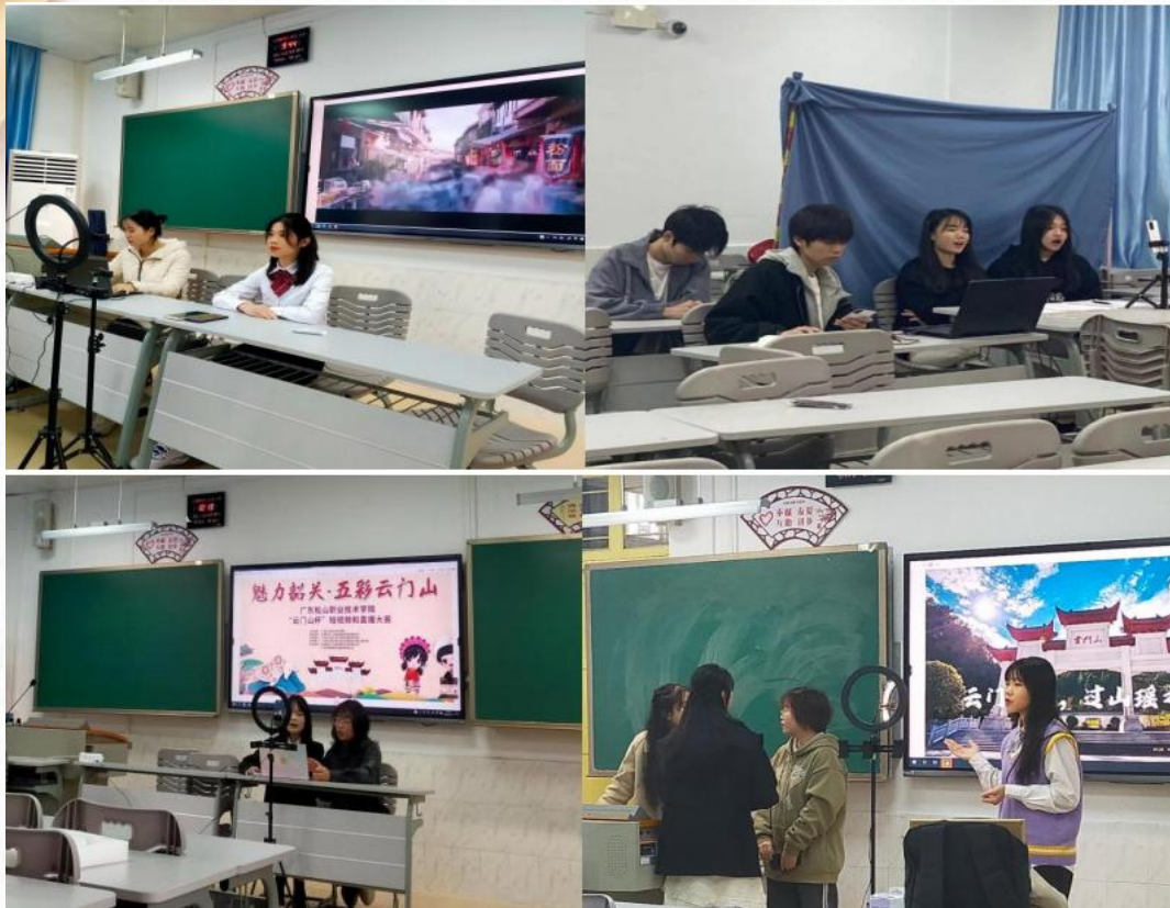
“云门山杯”短视频和直播大赛选手直播现场图

连续多年举办“松山之星”导游服务技能大赛。此项专业竞赛，不仅增强了学生的职业技能，同时选出了优秀选手为“广东省职业院校学生专业技能大赛（高职组）导游服务赛项”做好进一步的赛事准备，体现了我院“以赛促学、以赛促教、以赛促技”的教学理念。