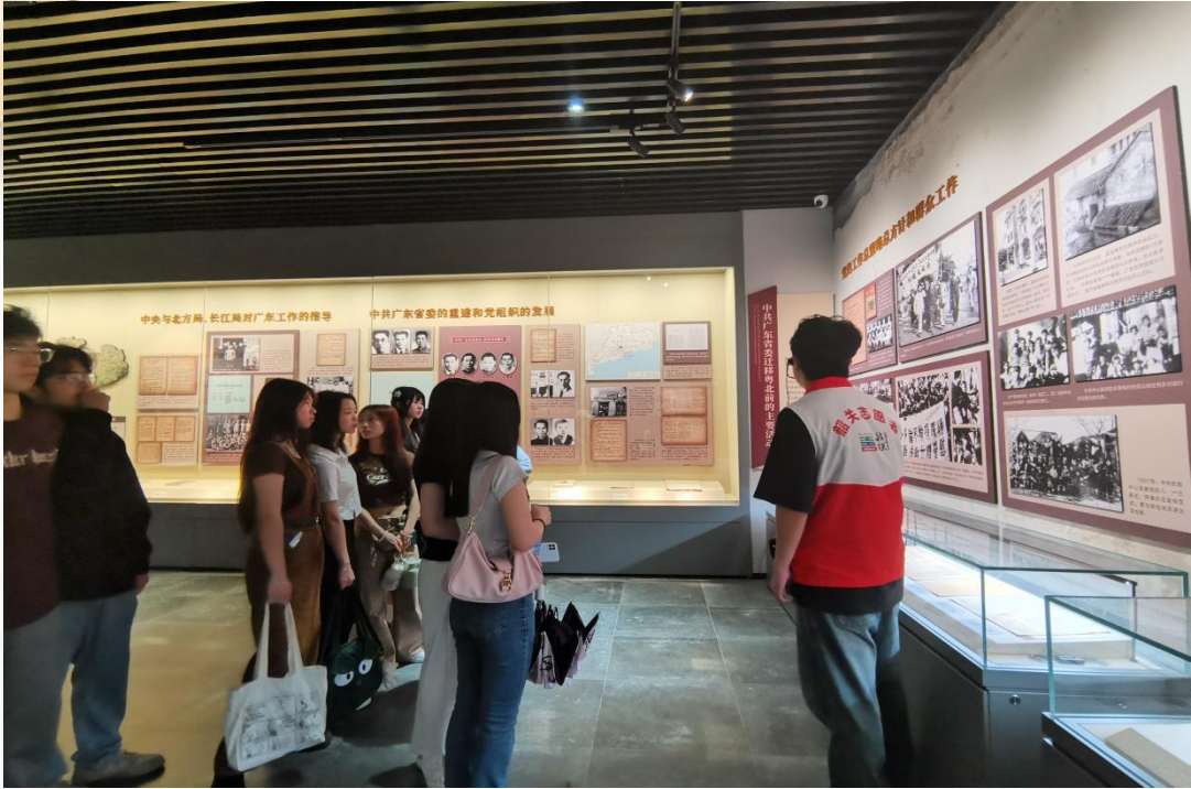
旅游管理学生在省委旧址开展志愿讲解活动