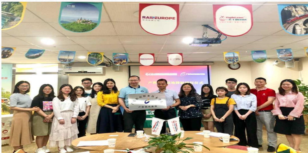
文化旅游学院师生到广州一起飞国际旅行社与顶岗实习毕业生交流

学院领导带领教师们进入校外实习基地企业与应届、往届毕业生进行座谈与面对面的沟通与交流，及时了解学生工作情况与开展企业人才需求调研，更好地促进校企双方深度合作。