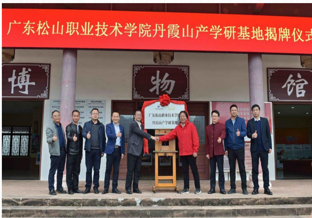
丹霞山产学研基地揭牌仪式