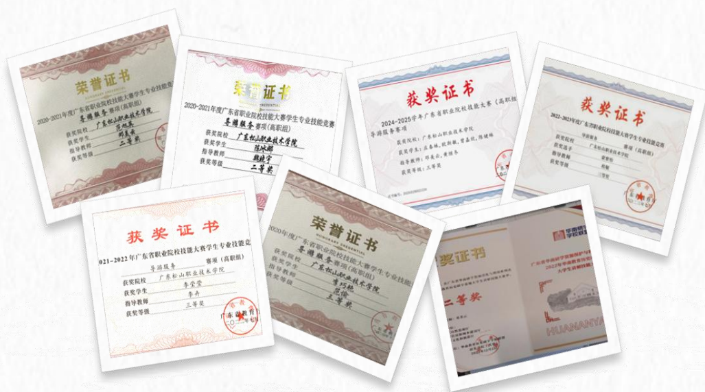
学生参加广东省职业院校技能竞赛部分获奖证书