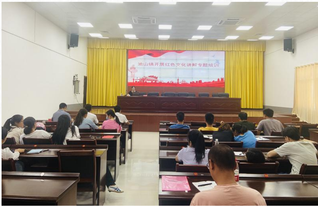
南雄油山镇开展红色文化讲解专题培训现场