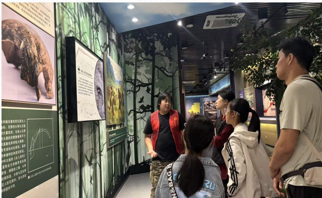
旅游管理学生在马坝人遗址开展博物馆志愿讲解活动