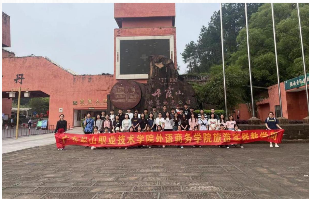
旅游管理专业师生前往丹霞山开展导游实训周活动

近年来，旅游管理专业为推进理实一体化教学、提升学生专业实践能力，春季学期定期开展景区导游实训周活动。实训周以岗位需求为导向，涵盖导游词撰写、景点讲解等核心模块，采用“校内模拟+校外实景”模式，邀请行业专家现场指导，帮助学生将理论知识转化为实操能力，为后续实习和就业奠定基础。