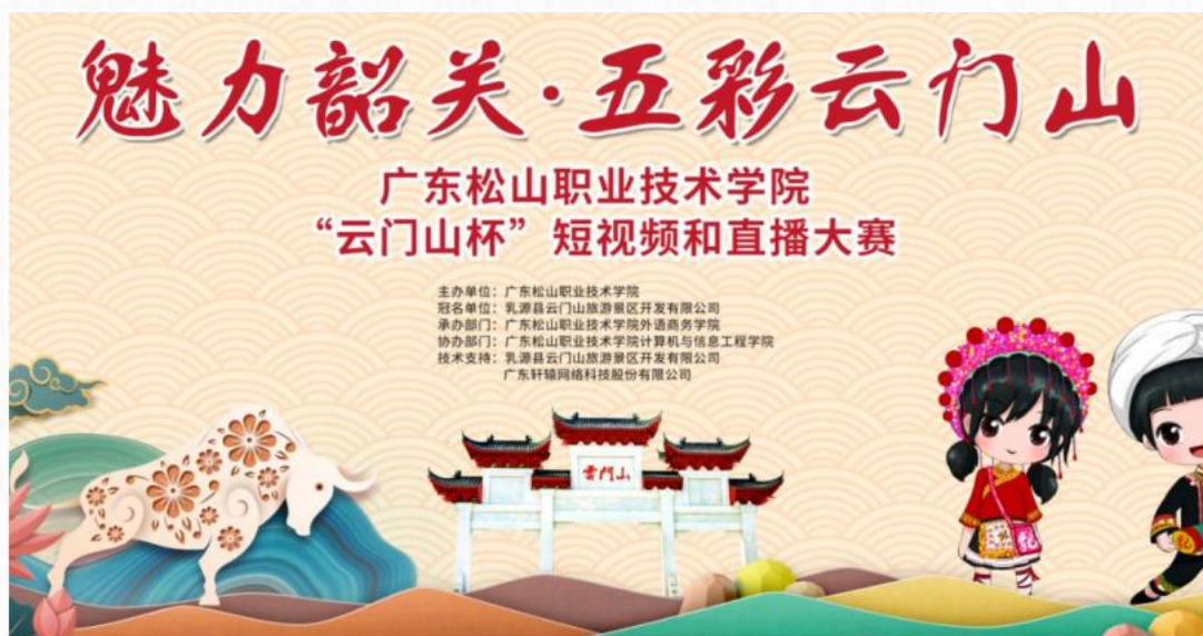
“云门山杯”短视频和直播大赛宣传海报

2022年，旅游管理专业学生参加我校与乳源县云门山旅游景区开发有限公司共同举办的“云门山杯”短视频和直播大赛。