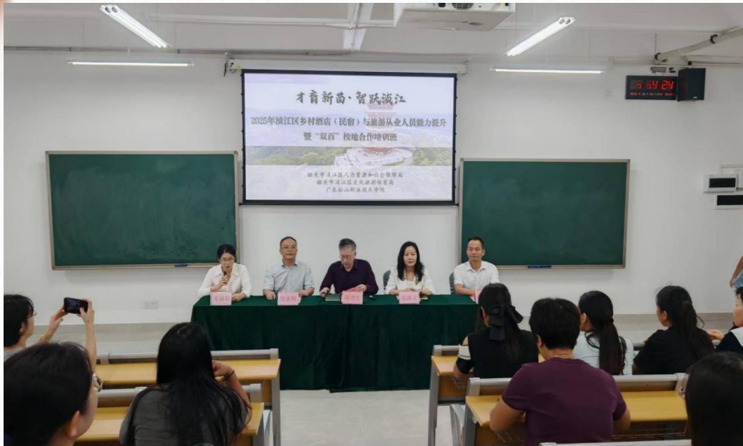
滨江区酒店（民宿）旅游从业人员能力提升暨“双百行动”培训班