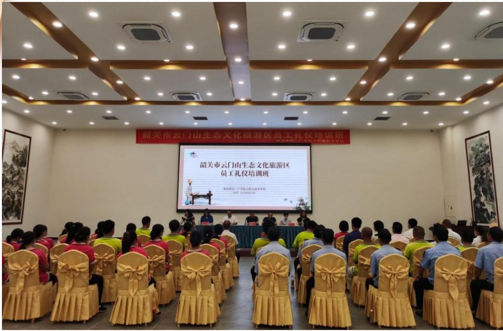
云门山生态旅游度假区旅游礼仪培训班开班仪式