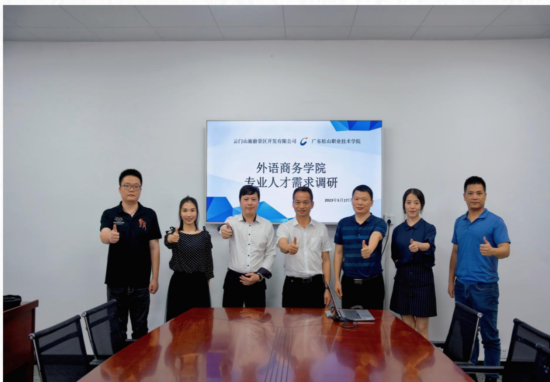
学院领导带队到韶关云门山旅游景区开发有限公司开展人才需求调研