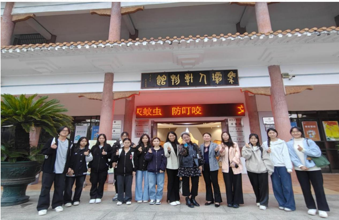
旅游管理学生参加曲江区委宣传部宣传宣讲素质提升培训班