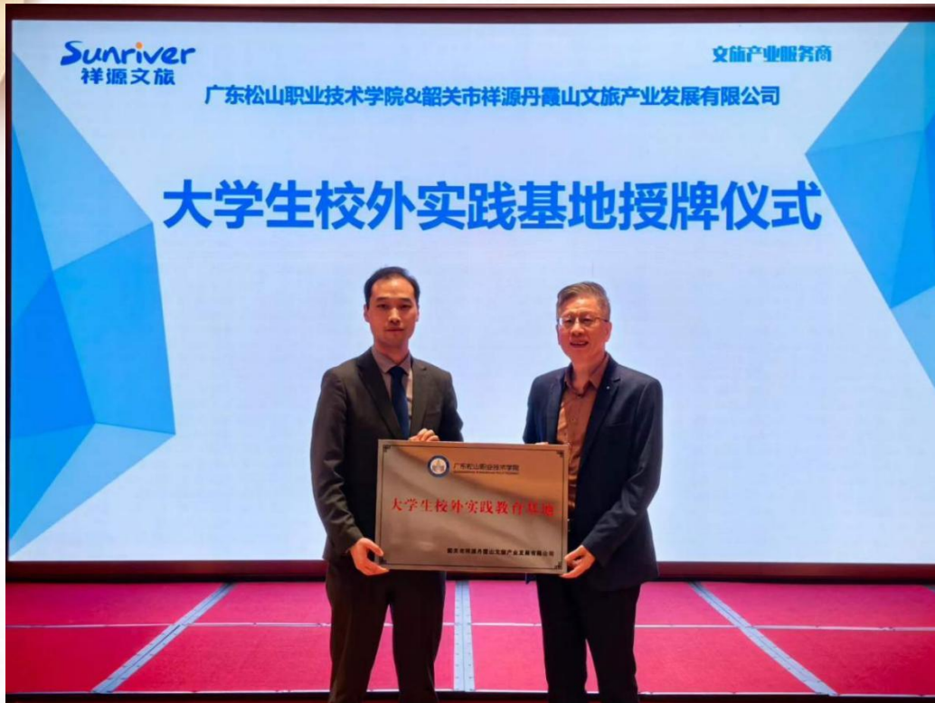
祥源丹霞山大学生校外实践基地授牌仪式