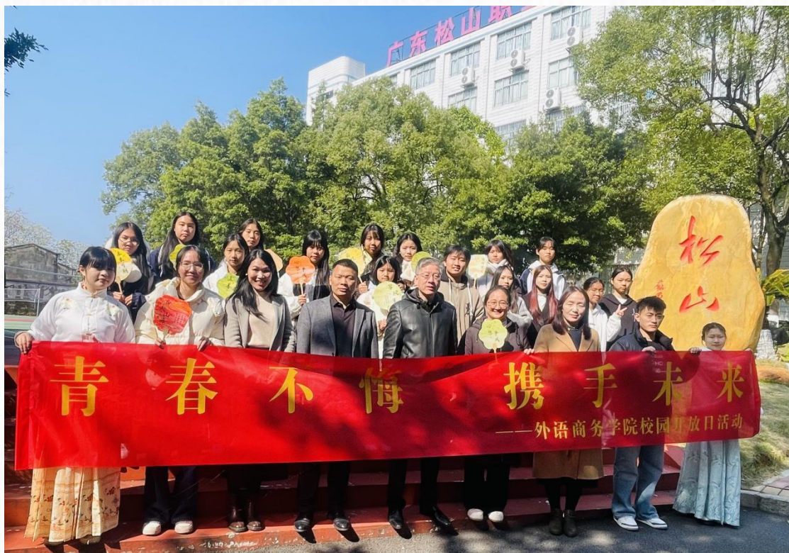
2025 年旅游管理专业三二分段开放日活动