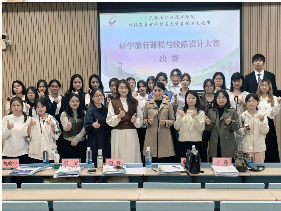
2025年首届研学旅行课程与线路设计大赛师生合影