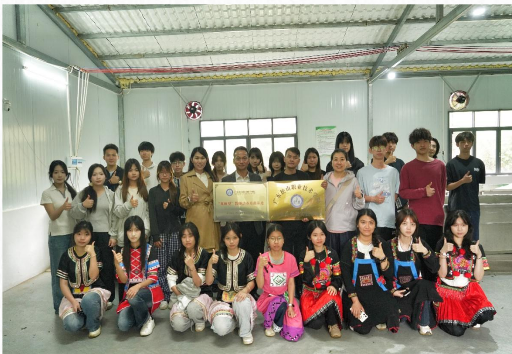
韶关市曲江区罗坑源山源农业旅游开发有限公司大学生校外实践基地授牌仪式