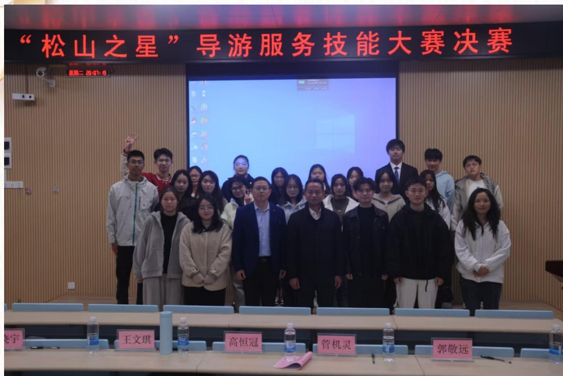
2025 年“松山之星”导游服务技能大赛师生合影