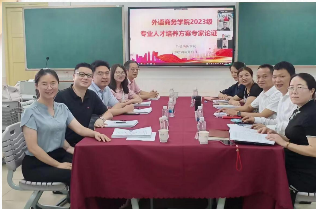
文化旅游学院专业人才培养方案论证校企专家合影