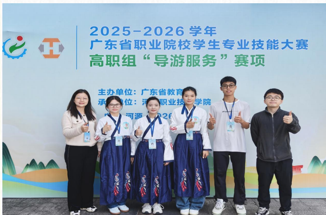
学生在 2025-2026 学年广东省职业院校学生专业技能大赛（高职组）导游服务赛项中荣获三等奖