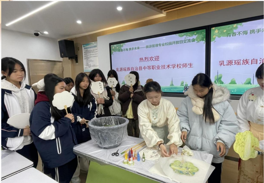
旅游管理专业三二分段开放日活动（非遗漆器体验）