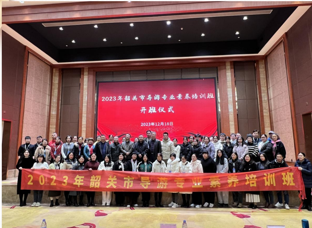
韶关市导游专业素养培训班开班仪式现场