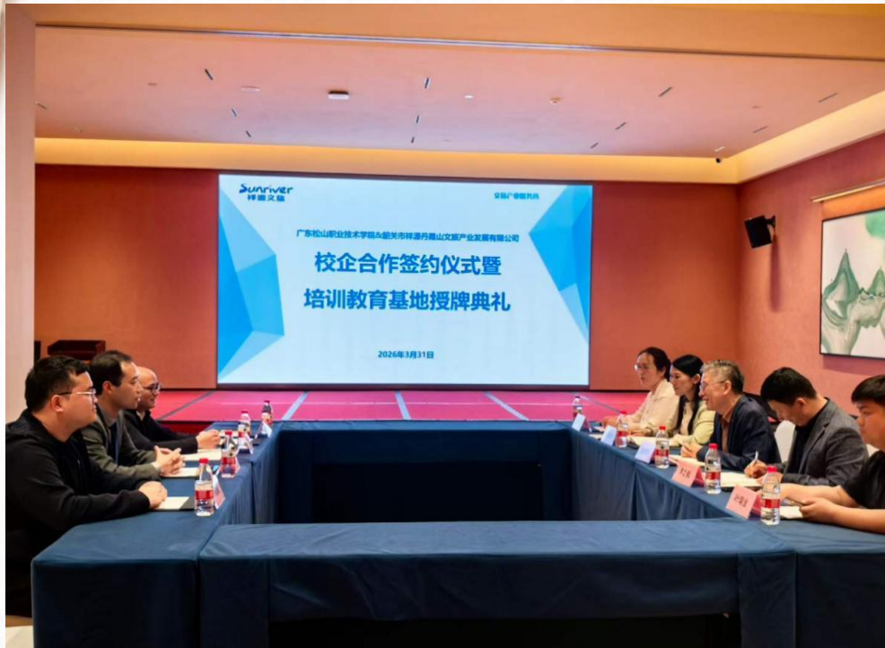
文化旅游学院与祥源丹霞山校企合作签约仪式