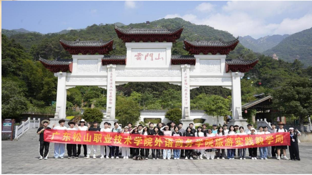
旅游管理专业师生前往云门山开展导游实训周活动